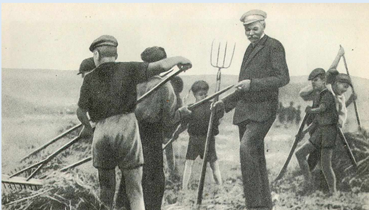
Максим Горький наблюдает за сельхозработами в детской колонии им. М. Горького, 1928 г.

Колония находилась за городом, и Макаренко фактически создал там успешное сельскохозяйственное предприятие, которое почти полностью обеспечивало себя всем необходимым и при этом функционировало на принципах детского самоуправления. Именно эти слагаемые успеха, по его глубокому убеждению, и действовали как целительный инструмент перевоспитания. Подростки сами распахивали землю, разбивали грядки и выращивали овощи, занимались животноводством, ремонтировали старые постройки и возводили новые, работали в кузнице и столярной мастерской, которые сами же и создали, обустроивали территорию: разбивали дорожки, строили изгороди и оранжерею.