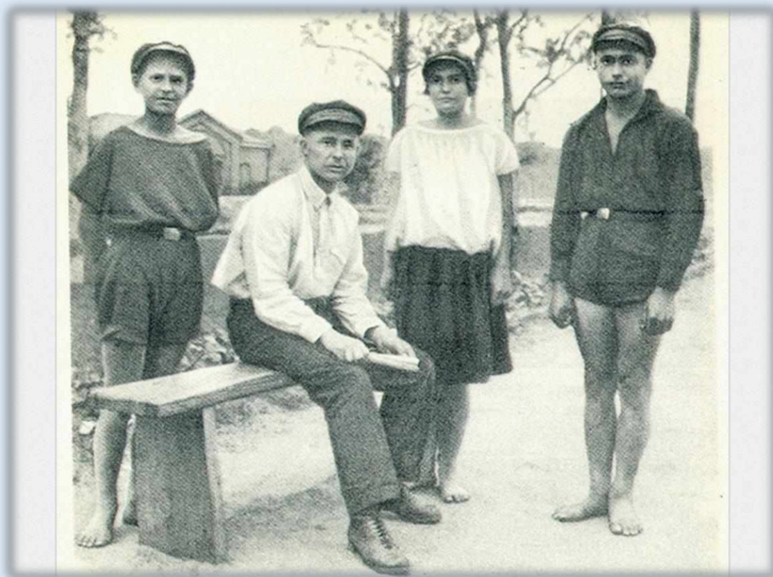
Дежурство по колонии, 1926–1928 гг.

Макаренко понимал, что никакой готовой педагогической теории для его задач нет, а значит, её придётся «извлечь из всей суммы реальных явлений, происходящих на глазах». И ему это удалось.